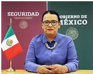
Rosa Icela Rodríguez Velázquez

伊於墨西哥前總統羅培茲政府任外交部長一職，於 2023 年起任墨國環境與自然資源部長，曾擔任聯合國多項高階職務，如前聯合國秘書長科菲安南辦公室主任及拉丁美洲及加勒比經濟委員會執行秘書等要職。