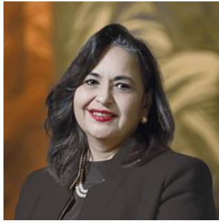
Norma Lucía Piña Hernández

2023 年起出任最高法院院長，係墨國首位女性最高法院院長，並在任內面對司法改革與行政權張力，致力維護司法獨立，伊任期至 2025 年 8 月 31 日。