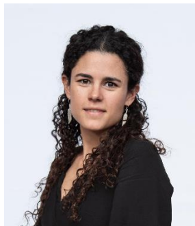
Luisa María Alcalde Luján

2020 至 2024 年曾任安全及公民保護部長 (Secretary of Security & Citizen Protection)，為首位女性擔任該職。