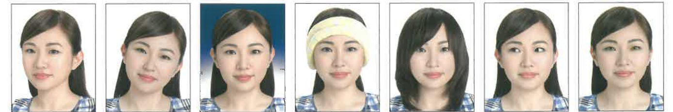
頭部側向一邊、未正視鏡頭 頭部傾斜不正 背景色彩非白色 臉部及雙耳被物品遮蔽 頭髮遮蔽到眼睛或耳朵 眼睛未正視鏡頭 使用有色隱形眼鏡