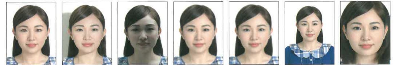
紅眼 背景有陰影 臉部陰影 解析度過低 模糊、對焦不正確 頭部比例過小 頭部過大·頭髮碰觸邊框