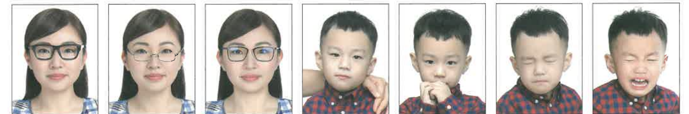
配戴粗框眼鏡 鏡框遮蔽到眼睛 鏡片反光 非獨照，出現其他人、物影像 嘴巴被手遮蔽 閉眼睛 表情不自然、哭泣