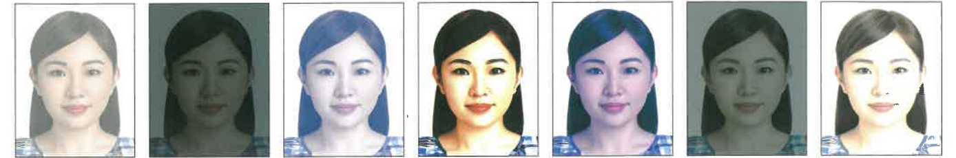
太亮 太暗 對比不足褪色 對比太強 皮膚色調不自然 曝光不足 曝光過度